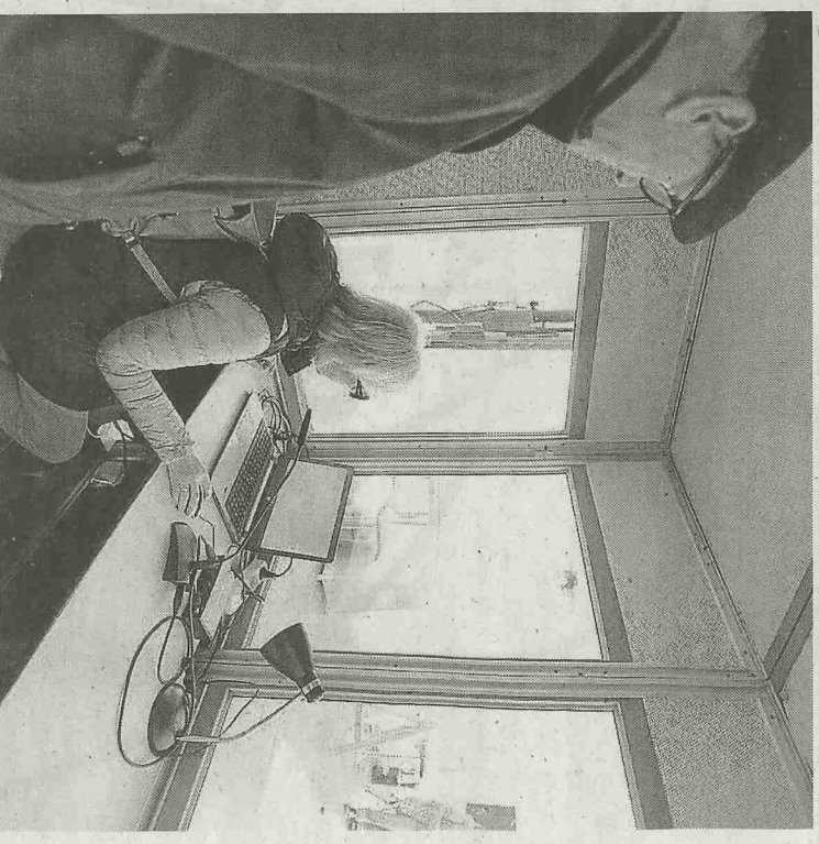
Gaitu ekimena sustatzeko saioa Donostian.

Eredu horiek lizentzia irekian argitaratu direnez, ikerketa proiektuetan zein aplikazio komertzialean erabili, egokitu eta integratu ahal izango dira. Modulo berri horiek eskuragarri daude jada, online gordailu irekietan. ●