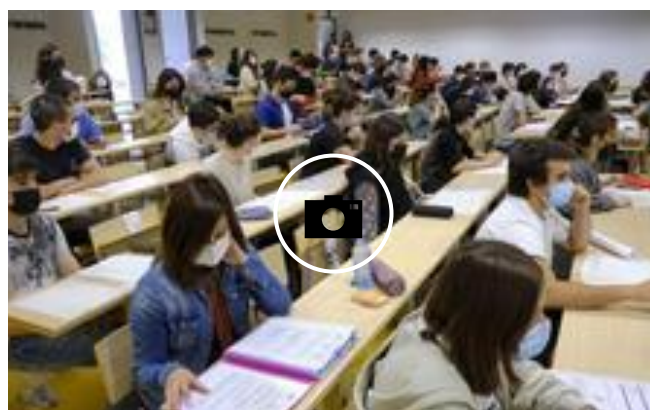
📷 Arranca la Selectividad para 4.618 alumnos guipuzcoanos